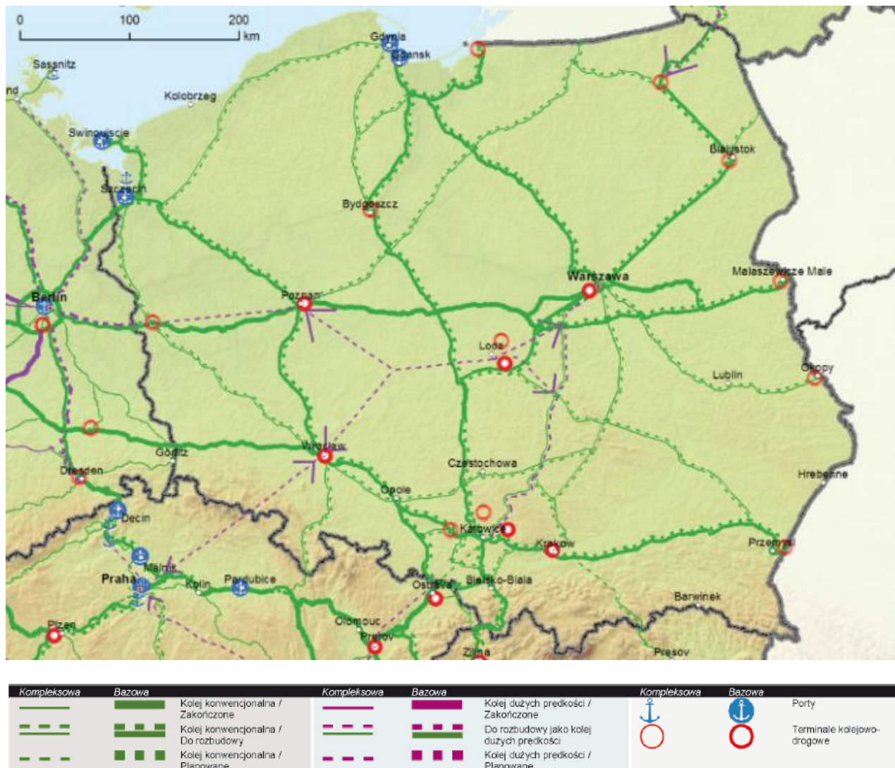
Rys. 2. Mapa kolejowej sieci TEN-T w Polsce dla pociągów towarowych